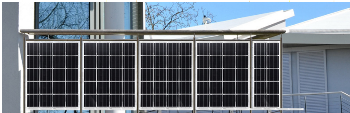
Die VITRUM balcony Solarbrüstung aus Verbundglas kombiniert geprüfte Sicherheit mit herausragendem Design

Zu weiteren erneuerbaren Energieträgern, welche in der Grösse der Eigenproduktion den Eigenverbrauch optimal – saison und standortgerecht zu ergänzen vermögen, zählen verschiedene Typen von Holzheizungen und nicht zuletzt die Geothermie.